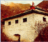
The "Temple Of Miraculous Fire" at Muktinath, Nepal. Photo by Ken Street (November 1979).

[For more on this subject, please read our tract The Temple Of Miraculous Fire. ]